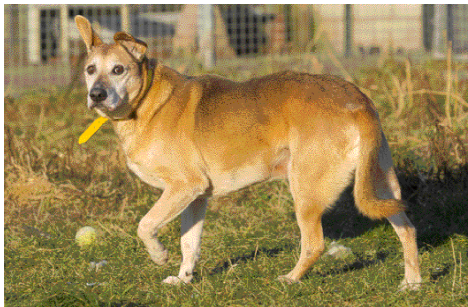
Lage staarhouding en pootheffen.

Voor informatie over kinderen en honden kunt u ook terecht op de site: www.kinderenendieren.nl