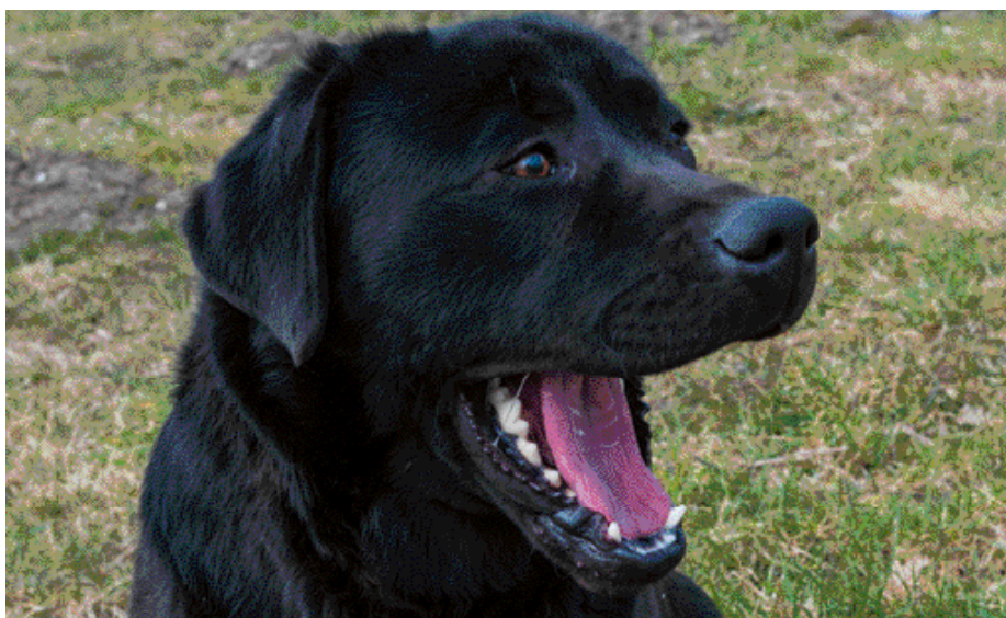
Gapen is een stresssignaal.