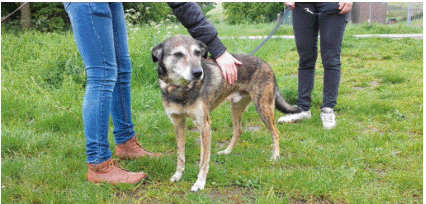
De hond ondergaat de benadering, maar is er onzeker door.

Om er achter te komen of een hond mogelijk onzeker is of niet, is het van belang te letten op het gedrag van de hond en op zijn lichaamshouding.